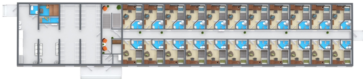
C15 - Entreprenörsboende

Med ett entreprenörsboende i anslutning till projektarbetsplatsen ges arbetaren dessutom ett bekvämt avstånd till jobbet. Genom att spara ner på restiden mellan hem och arbete ges du ökad produktionstid samtidigt som belastningen på klimatet minskar.