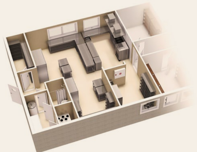
Fullt utrustat kök utvecklat i samarbete med Electrolux.