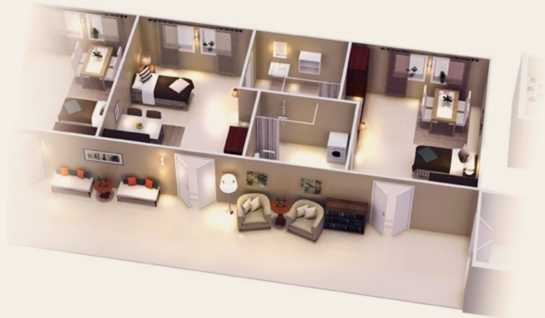
Lägenhetsrum och breda korridorer med loungeytor.