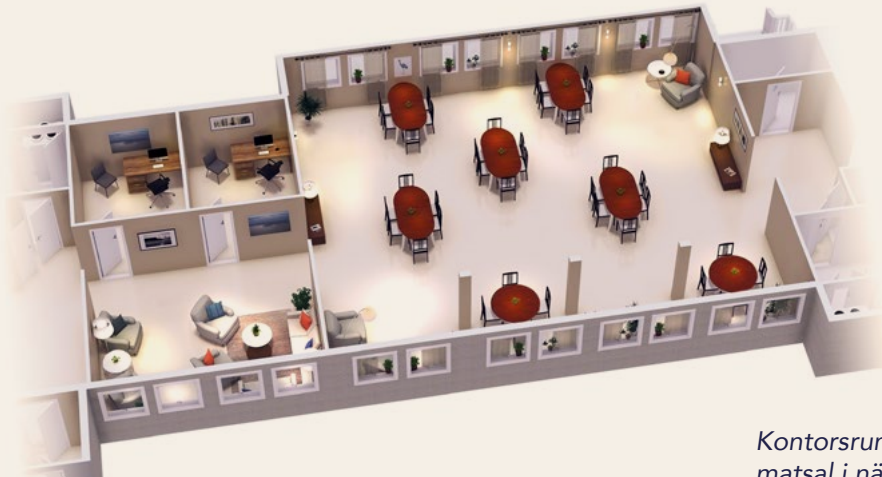
Kontorsrum, lounge- och matsal i nära anslutning.